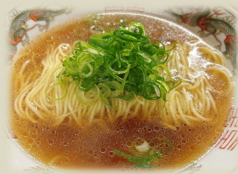
守源の締めと言えばこちら! 素ラーメン